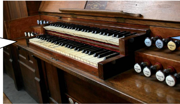
Clavier sup.: Récit