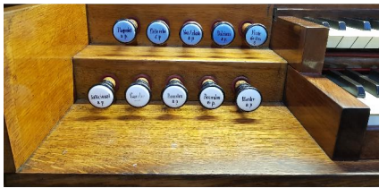
Clavier inf.: G.O. 56 notes