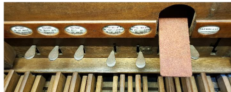
Pédalier 30 notes